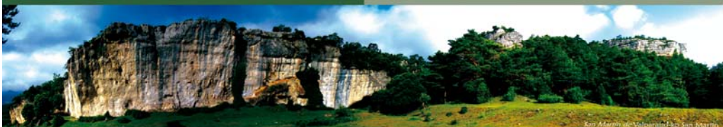
San Martín de Valparaíso-Eko San Martín

Diseinu eta koordinazioa / Diseño y coordinación: Orbea. Dokumentazioa / Documentación: Beatriz Herrera, M o José Sagardoy. Ilustrazioak / Ilustraciones: Ángel Domínguez.