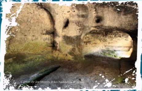
Cueva de los Moros II-ko haitzuloa (Cerro)

Los eremitas elegían emplazamientos donde abundaran las rocas blandas, fáciles de trabajar con rudimentarias herramientas como las azuelas. Las cuevas artificiales eran su hogar, su lugar de culto y el emplazamiento para enterrar a los muertos. Los huecos para abrir ventanas y puertas, las repisas, las hornacinas, incluso las tumbas eran excavadas en la roca.